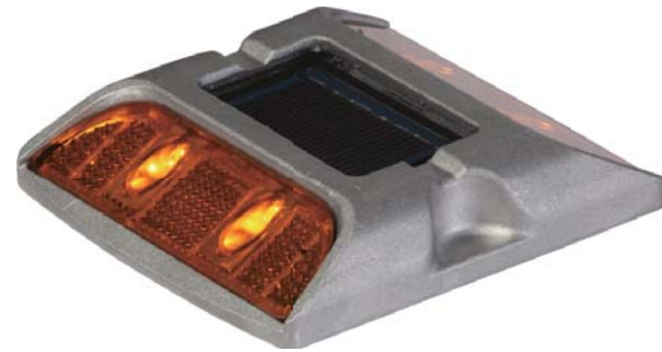
• MS-100 DSY